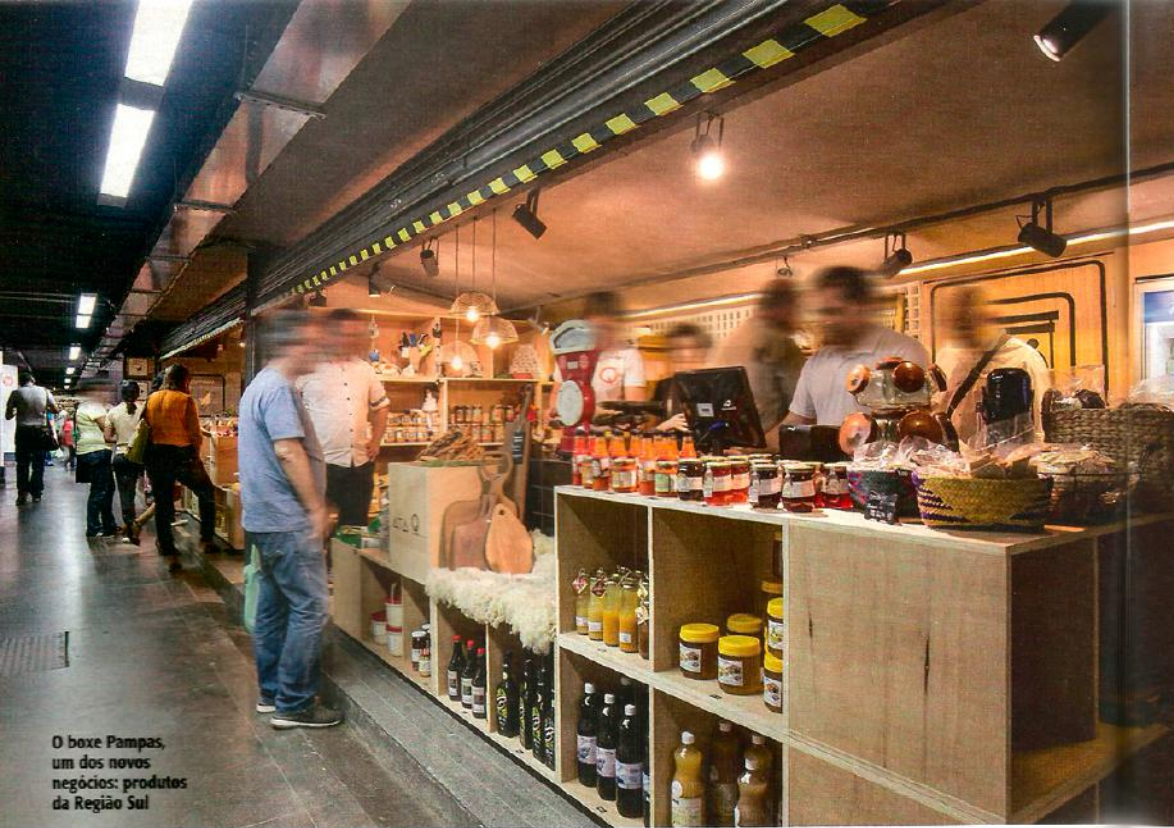
O boxe Pampas, um dos novos negócios: produtos da Região Sul